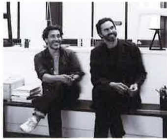
バーバー & オズガビー Barber & Osgerby / UK