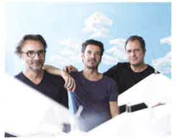
アトリエ・オイ atelier oï / Swiss