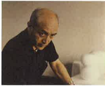
イサム ノグチ Isamu Noguchi / USA